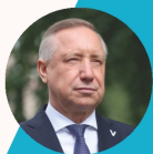
Губернатор Санкт-Петербурга Александр Беглов

— Мы продолжаем повышать уровень поддержки петербургских семей с детьми. Однако, чтобы повысить рождаемость, необходим комплексный подход, включающий улучшение жилищных условий, доступность качественной медицины, возможность обучения и работы для женщин, развитие семейно-ориентированной инфраструктуры. Нам недостаточно только финансово поддерживать семьи. Нужно создавать условия, чтобы люди чувствовали себя уверенно, могли совмещать карьеру и семью.